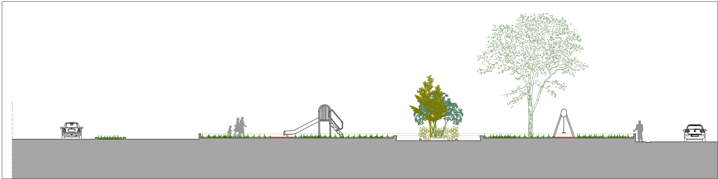
SEZIONE A - GIARDINI EX SAVORANI - scala 1:200